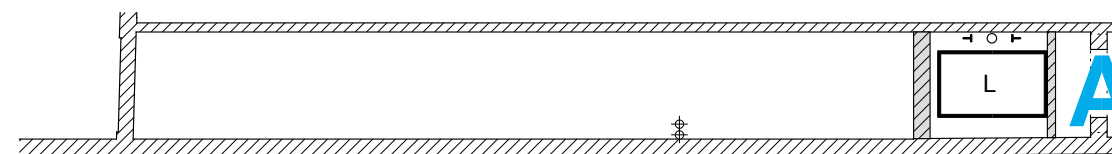
1e VERDIEPING / INSTEELK